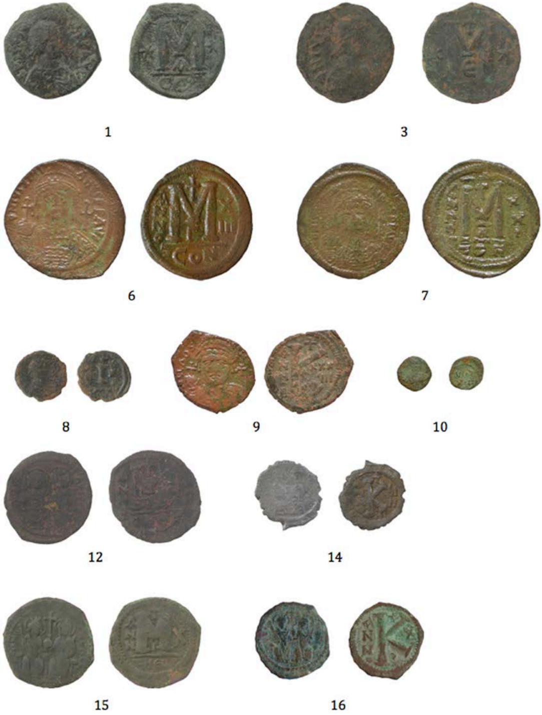
Fig.7. 1, 3, 6-10, 12, 14-16 Katalog No.lu Sikkeler