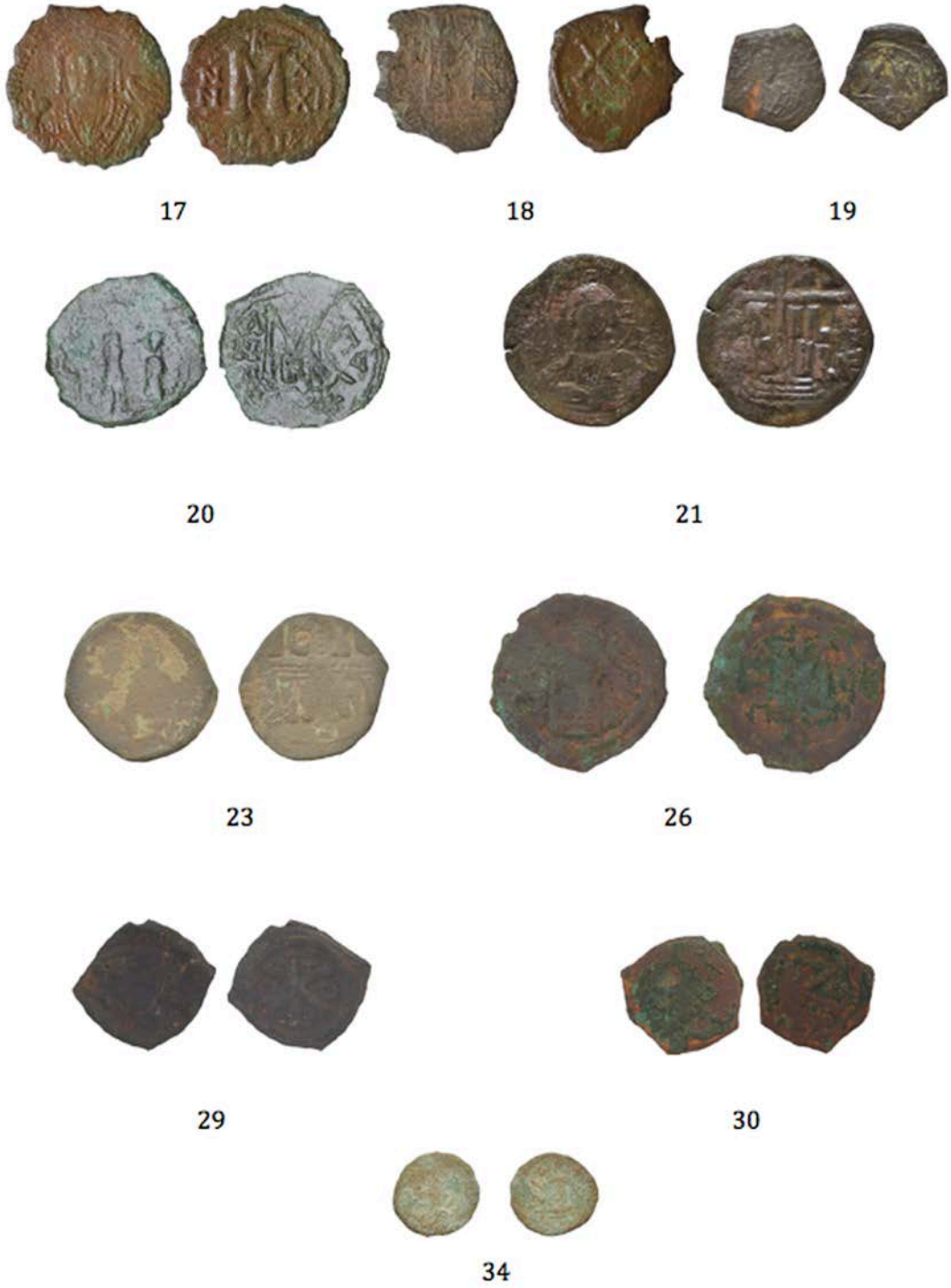
Fig. 8. 17-21, 23, 26, 29-30, 34 Katalog No.lu Sikkeler