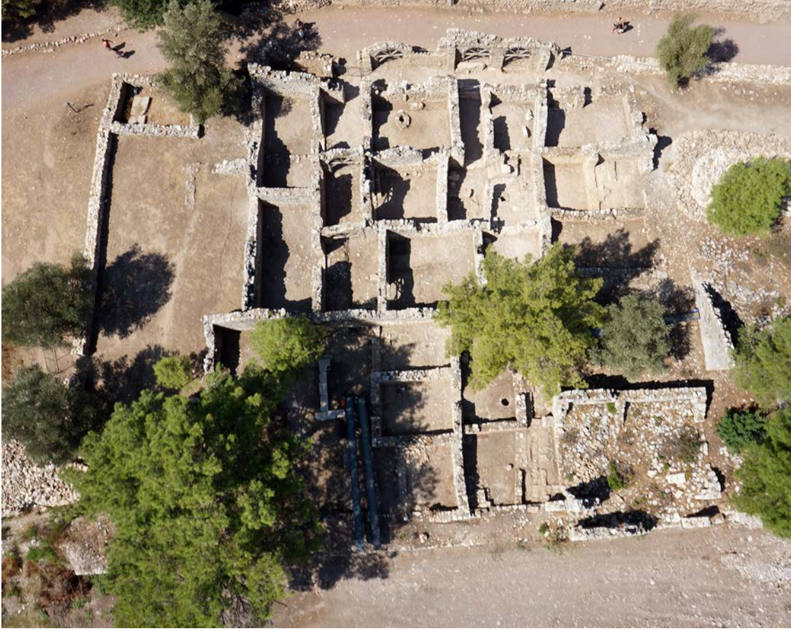
Fig. 3. Giriş Kompleksi