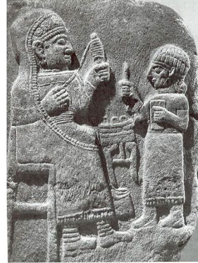
Fig. 2. Maraş Steli (MÖ 825-750). Yün eğiren kadın. (Yakar ve Taffet'ten aktaran Yakar 2018, 3)

Dokuma tanrıçası olarak Uttu, Mezopotamya'daki en yaygın kadın mesleklerinden birini temsil eder. Uttu, her şeyi doğru yapan bir erdem örneği olarak kabul edilir. O, evde olan, ata-erkil evliliği kucaklayan ve çalışkan bir kadındır 75 . "Enki ve Dünya Düzeni" adlı edebi çalışmada, tanrıça Uttu kadınlarla ilgili her şeyden sorumlu olan tanrıça olarak geçer. Yaşam deneyimleri, bu tanrıçanın hem "sadık eş" hem de "usta dokumacı" olmasını sağlar ve bu nedenle Sümerli eşler için iyi bir model olur 76 . Vanstiphout, kadının toplumdaki misyonu için Uttu ve İnanna'nın benzer özellikler taşıdığını ileri sürer. Kramer-Maier de, "Enki ve Ninhursag: Sümer Cennet Mit"inde Uttu'yu şehvetli kadın olarak çevirir 77 . Ancak "Enki ve Dünya Düzeni" mitinde Uttu'nun şehvetli yönünün 78 yerine dokumacılığı ve iyi bir eş olarak anne rolü vurgulanmıştır 79 . Uttu'nun adı doğrudan geçmese de "Enki ve Ninmah" mitinde geçen dokumacı tabiri Uttu olarak düşünülebilir: "Altıncı, o, doğum yapamayan bir kadın biçimlendirdi/ Enki bir dokumacı gördü ve kraliçenin hanesine kattı" 80 . Rodin, burada dokumacı kelimesinin sadece C metninde geçtiğini, Metin A'da "doğum yapamayan kadın, kraliçenin evine yerleştirilir" ibaresinin göze çarptığını ve A metninde onun dokumacı olarak çalıştırıldığını düşünmenin mümkün olduğundan bahseder.