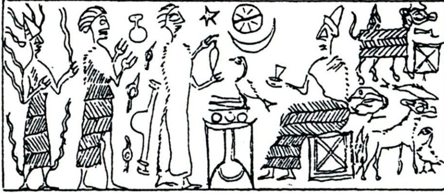
Fig. 1. Kültepe- Kaneş. Silindir mühür baskısı. (Teissier, 1994, No. 348'den aktaran Maner 2018, 47)

Burada çalışan işçiler hakkında bilgi aldığımız kaynaklardan bazıları yiyecek dağıtım listeleri ve işçi listeleridir. Örneğin Eblada'ki yiyecek dağıtım listesinde 900 dokumacı ve tahıl öğütücüsü kadının çalıştığı kayıtlıdır. Yine Lagaş'taki bir tekstil atölyesinde 6000'in üzerinde dokumacı kadın işçi görülür 62 . Mezopotamya'daki tekstil üretimini kraliçe ve yüksek sınıfa ait kadınlar kontrol ederdi 63 . Hemen hemen her kentte kraliçelere bağlı, "Emunus Birliği" adı verilen kadın işçiler birliği bulunurdu 64 . Erken Hanedanlar Dönemi'nde ve III. Ur Hanedanı Dönemi'nde Lagaş kentinde kraliçeye ait "hane"lerde çalışan kadın/erkek işçiler (Sümerce gême ve guruş ) bulunurdu. Kadın dokumacı ( geme 2 uş-bar ) olarak geçmektedir 65 . Lagaş kentindeki "kadın evi"nde 66 çalışanların yarısı dokumacı kadınlardan 67 oluşur 68 . Onlar, çalışmaları karşılığında arpa, buğday, yün ve yağ alırdı. Pay sistemi ile ödenen maaşlar yaşa, statüye, cinsiyete göre değişiklik gösterirdi. Aldıkları bu ödeme erkek çalışanların yarısı kadardı 69 .