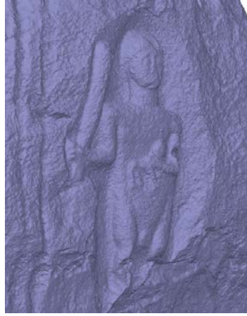
Fig. 3c (Model A. B. Can)