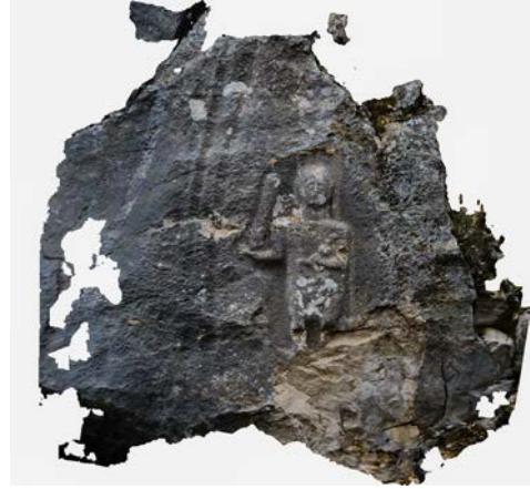
Fig. 3a. Üçoluk Herakles Kabartması 3d Görünüm (Model Ş. Kileci)

Herakles kabartmasının bulunduğu Üçoluk ve çevresi ilk olarak Beydağları yüzey araştırmalarında, Mnara kent teritoryumu içerisinde incelenmiş ve kabartma budaklı sopsasından dolayı Herakles olarak tanımlanmıştır 3 . 2016 yılında yürütülen Phaselis teritoryum çalışmalarında da Herakles kabartması görülmüş ve belgelenmiştir 4 . Bu araştırmalar esnasında yüksek ve engebeli olan Üçoluk Yaylası ve etrafında Roma Dönemi'ne ait yoğun çiftlik yerleşimleri tespit edilmiştir 5 . Bu çiftliklerle bağlantılı Beşiktaş mevki, Üçoluk Yaylası Kırtepe ve Uzuntaş mevkinde tekil ya da gruplar halinde lahit ve khamasorion tipi mezarlar dijital arkeoloji metodlarıyla incelenmiştir 6 . Ekizce /Sedir Yaylası Tahtacı Mezarlığı olarak bilinen bölgedeki araştırmalarda ise Ares kutsal alanında çok sayıda