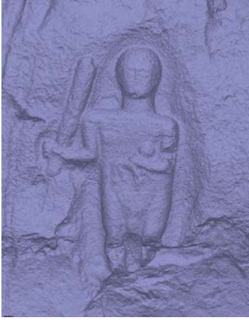
Fig. 3b (Model A. B. Can)