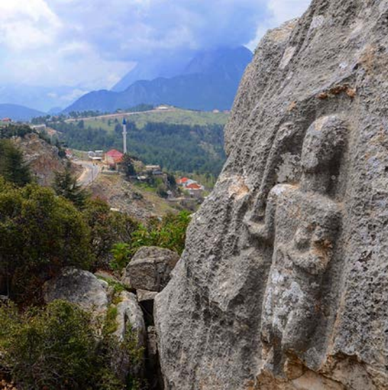
Fig. 4. Üçoluk Herakles Kabartması ve Üçoluk Mahallesi

Phaselis teritoryum arařtırmalarında bu yüksek yayla coğrafyasının nasıl ve ne zaman kullanıldığı hakkında önemli veriler ortaya konulmuřtur. Bunlardan Üçoluk Yaylası, Uzuntař Mevki'nde tespit edilen çitlik yerleřimiyle baėlantılı khamosorion önemlidir. Khamosorion üzerinde okunan yazıta göre mezar Kolalemis ile Termela'ya aittir ve yazı karakteriyle MS III. yüzyıla tarihlendirilmektedir 8 . Aynı ana kayada bulunan iřlik ve Litus çiftliėin geçim ekonomisini de ortaya koymaktadır 9 .