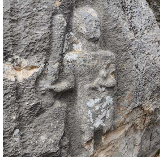
Fig. 5. Üçoluk Herakles Kabartması

Üçoluk Mahallesi'nin doğusunda Ekizce Yaylası'nda, Herakles kabartmasıyla baėlantılı Ekizce Ares kutsal alanı ise oldukça dikkat çekicidir 10 . Alanda Ares'e adanmış yüze yakın yazıtlı ve yazısız adak steli ve yazıt fragmanı tespit edilmiştir 11 . Yazıtlı adak stellerinin çok azı tarihlendirilebilmiştir. Adak