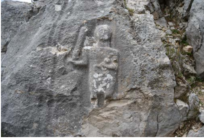
Fig. 2. Üçoluk Herakles Kabartması