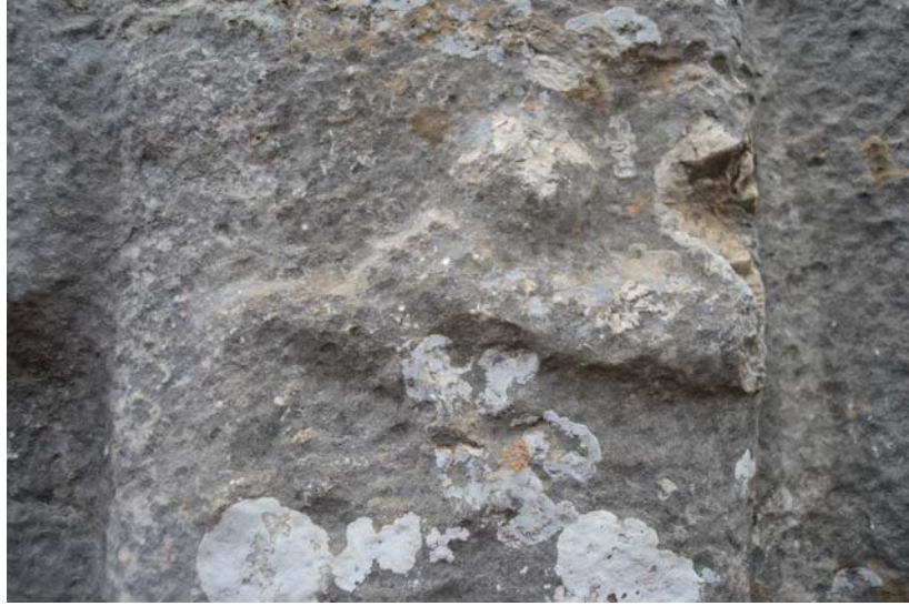
Fig. 6. Üçoluk Herakles Kabartması Nemea Aslanı

sürecinde Herakles ile birleştirilerek ortak bir ikonografik anlatıma sahip olduğunu gösterir. Öyleki aynı kayalıktaki kabartmalarda dahi, aynı tasvir ile anlatılan Herakles ile Kakasbos'un ayırt edilebilmesi için yazıtın olması gereklidir. Dolayısıyla yerel tanrı Kakasbos, Herakles'in lobutunu alarak aynı anlamda ve aynı şekilde tapınım görmüştür 22 .