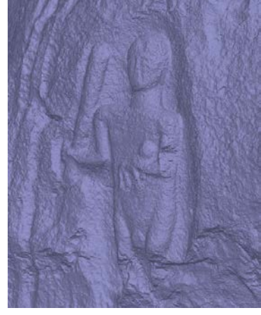
Fig. 3d (Model A. B. Can)

Phaselis teritoryum arařtırmalarında bu yüksek yayla coğrafyasının nasıl ve ne zaman kullanıldığı hakkında önemli veriler ortaya konulmuřtur. Bunlardan Üçoluk Yaylası, Uzuntař Mevki'nde tespit edilen çitlik yerleřimiyle baėlantılı khamosorion önemlidir. Khamosorion üzerinde okunan yazıta göre mezar Kolalemis ile Termela'ya aittir ve yazı karakteriyle MS III. yüzyıla tarihlendirilmektedir 8 . Aynı ana kayada bulunan iřlik ve Litus çiftliėin geçim ekonomisini de ortaya koymaktadır 9 .